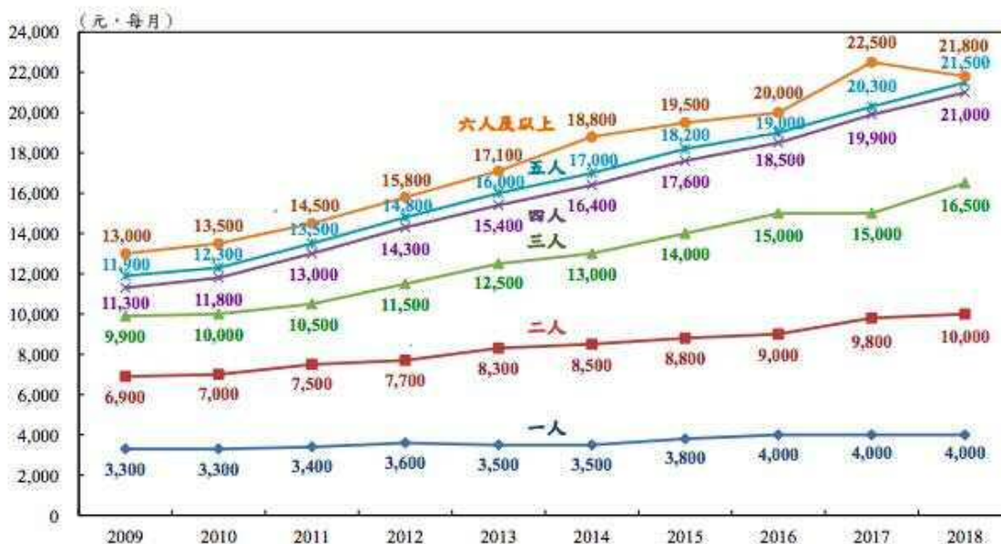
圖 2.9：2009-2018 年貧窮線，按住戶人數劃分